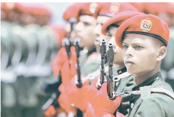
Николас Мадуро призывает население страны к мобилизации

В это время Николас Мадуро призывает жителей Венесуэлы бороться с насильственными действиями со стороны сил правого толка. Одновременно он призвал венесуэльцев к национальному единству, чтобы сорвать план возможного вмешательства в дела страны извне. По официальной версии, США силой спровоцировали в Венесуэле экономический кризис, а