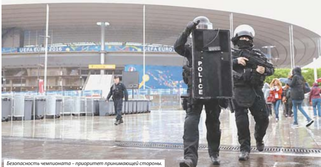
Безопасность чемпионата – приоритет принимающей стороны.